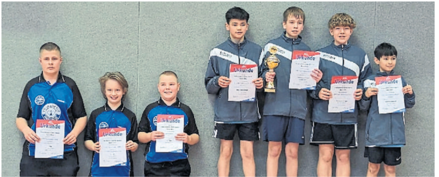
Bezirkspokalsieg: Toller Coup im Vogelsberg